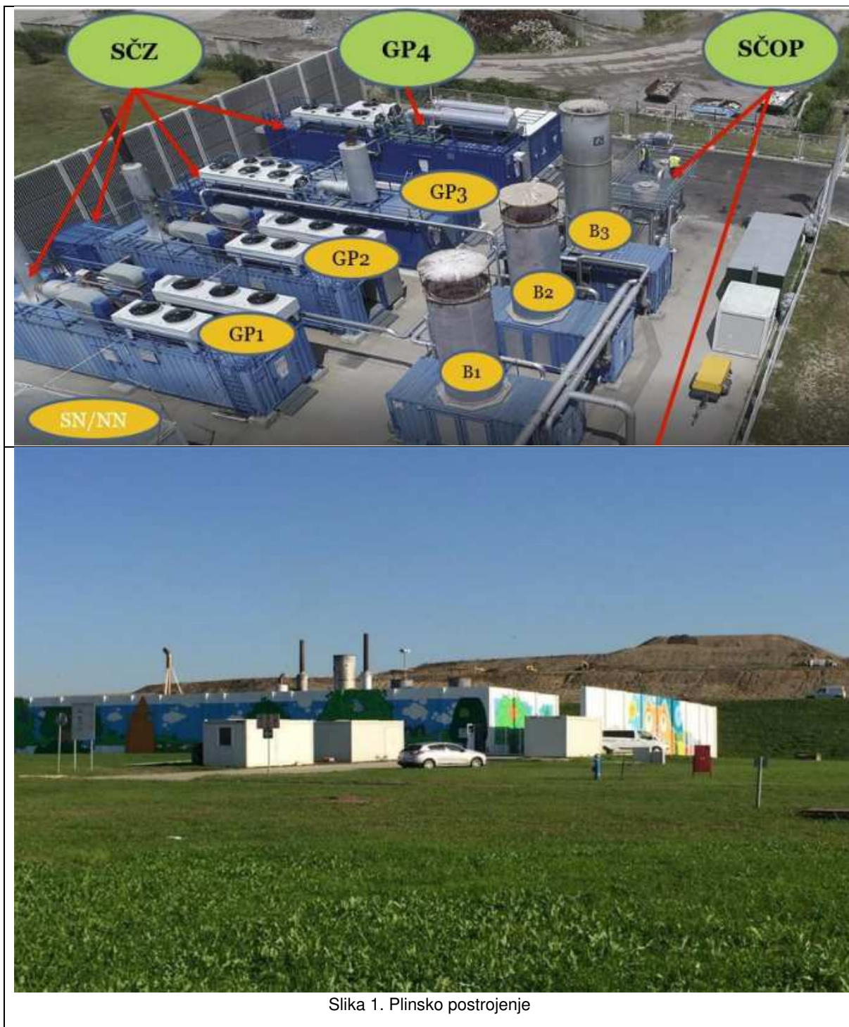
Slika 1. Plinsko postrojenje

Na slici u nastavku prikazano je mjerno mjesto.