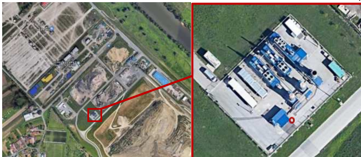
Slika 2. Mjerno mjesto na Odlagalištu otpada Jakuševac